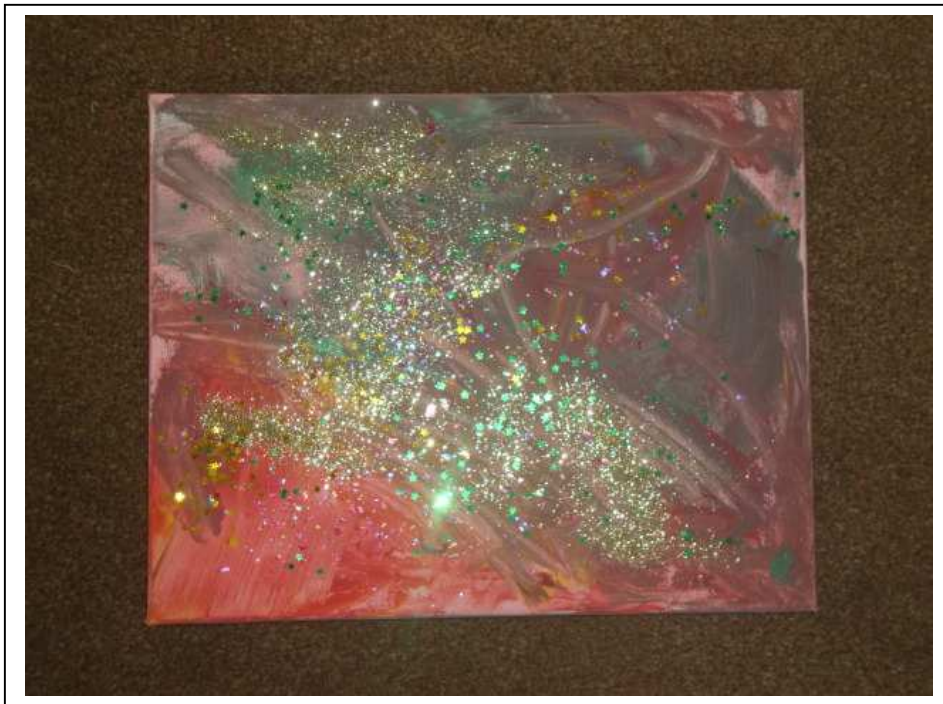
Mon cadeau d'anniversaire confectionné par les enfants

Le petit déjeuner terminé, place aux jeux : plusieurs jeux de sociétés sont à la disposition des enfants comme des jeux de carte ou de mémoire par exemple, mais également des Lego, des petites voitures. Des activités manuelles sont également possibles dans le coin atelier artistique. Là, ils ont accès à la pâte à modeler, aux crayons feutres, bois, pastels ..., aux autocollants, aux paillettes et encore bien d'autres choses qui leur permettent de faire de jolis dessins pour leur parents et de jolis souvenirs pour moi.